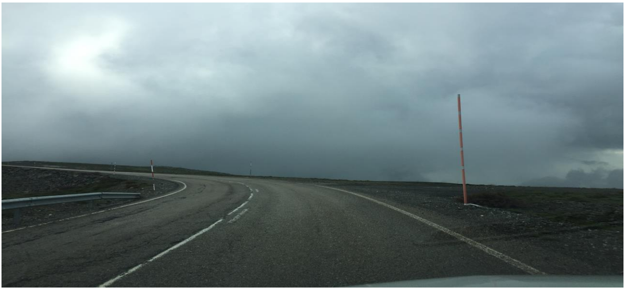
META. Km. 64,500. LE-726