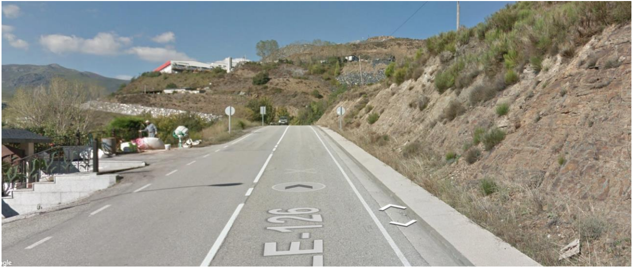
SALIDA. Km. 55,700. LE-726 Frente a la última casa saliendo de La Baña