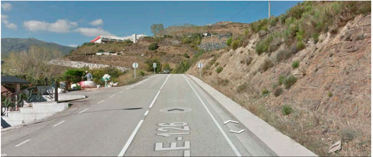
SALIDA. Km. 55,700. LE-726 Frente a la última casa saliendo de La Baña