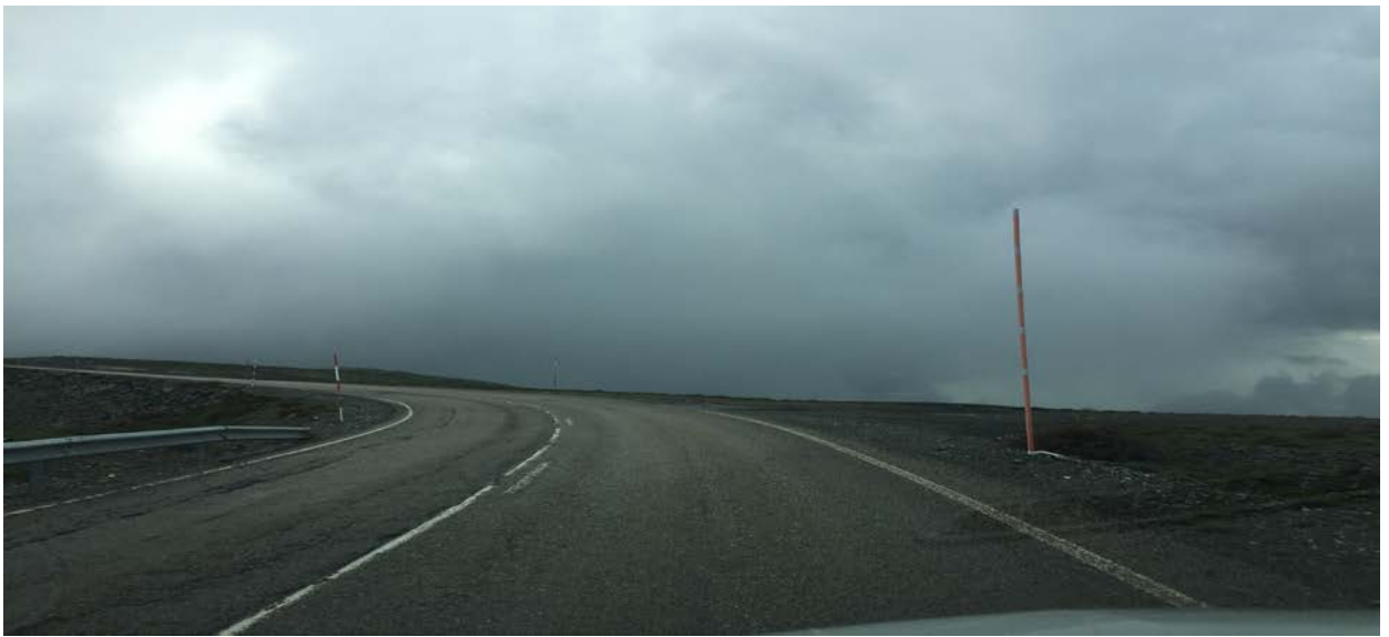
META. Km. 64,500. LE-726